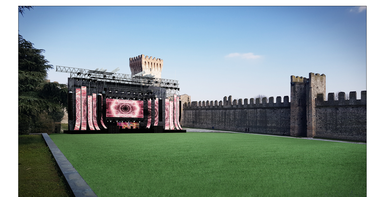
fotoinserimento palco spettacoli con platea piana ed inerbata

REGIONE VENETO PROVINCIA DI PADOVA COMUNE DI ESTE