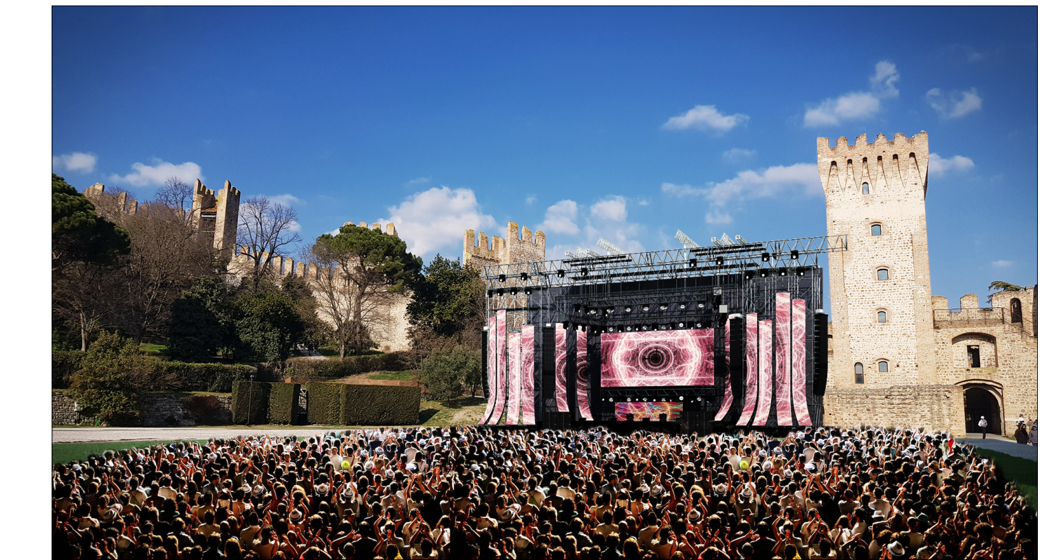
fotoinserimento palco spettacoli con platea posti in piedi