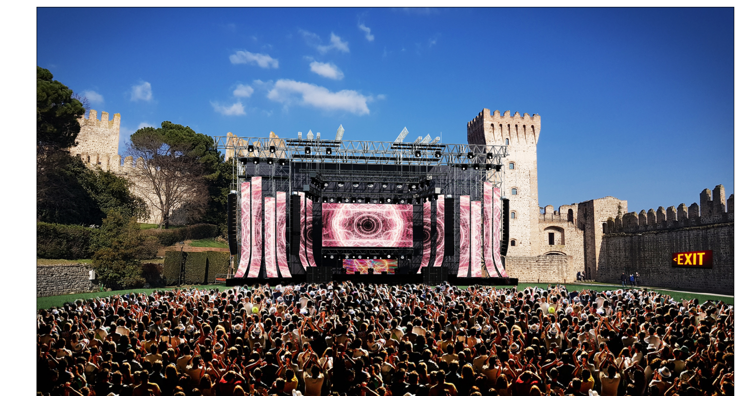
fotoinserimento palco spettacoli con platea posti in piedi